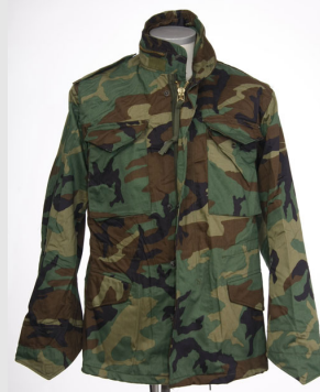
Field jacket M-65 Mimetiche Made in USA